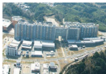
九州大学伊都キャンパス

会場 九州大学伊都キャンパス (〒819-0395 福岡市西区元岡744) 福岡市産学連携交流センター (〒819-0388 福岡市西区九大新町4-1) 福岡大学理学部 (〒814-0180 福岡市城南区七隈8-19-1)