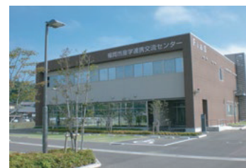
福岡市産学連携交流センター